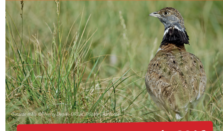
Outarde mâle