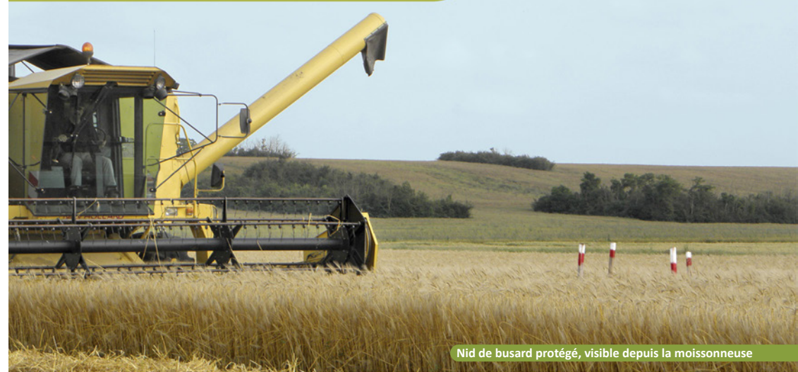
Nid de busard protégé, visible depuis la moissonneuse

Suivi et protection des nichées en Charente-Maritime