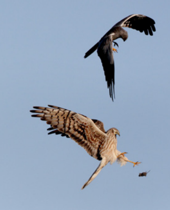
Mâle de busard des roseaux