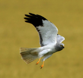
Mâle de busard Saint-Martin Mâle et femelle de busard cendré