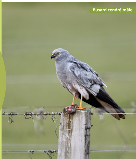
Busard cendré mâle

La participation des agriculteurs est très précieuse car elle fait gagner beaucoup de temps et permet d'agir efficacement.